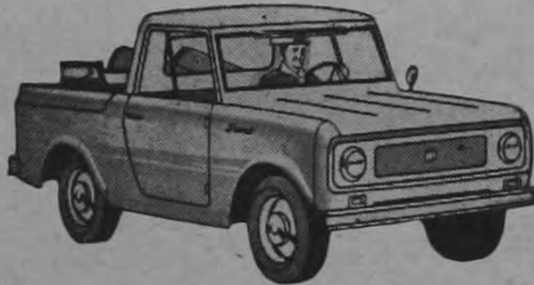
SCOUT INTERNATIONAL MODELO PICK-UP