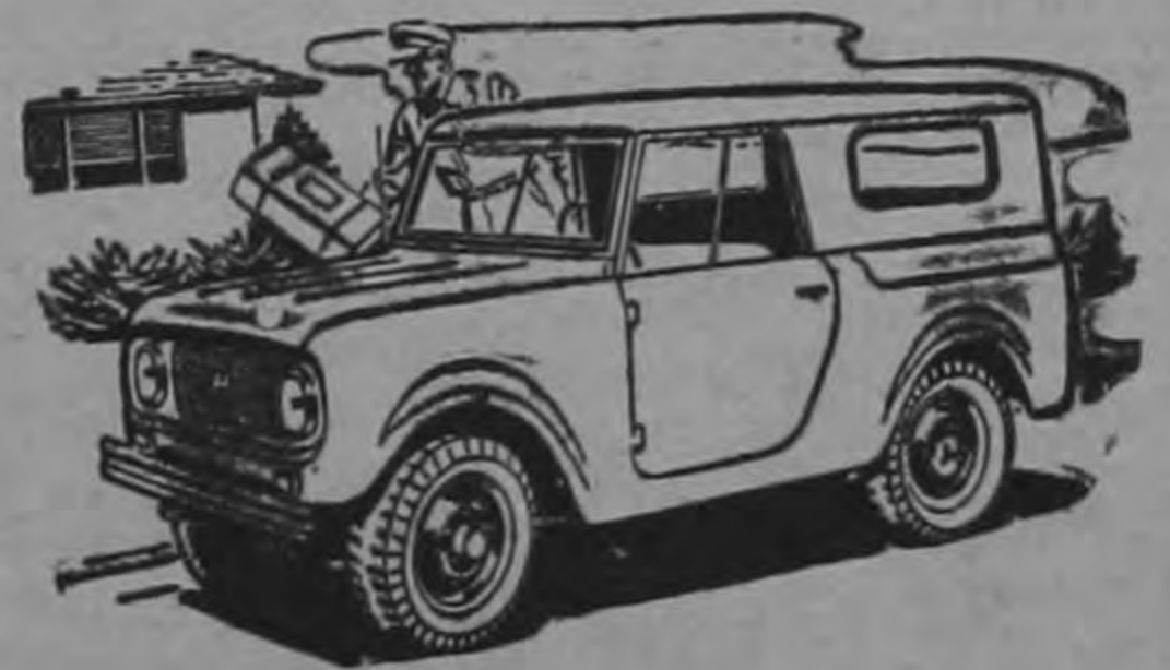
SCOUT INTERNATIONAL MODELO TRAVEL-TOP