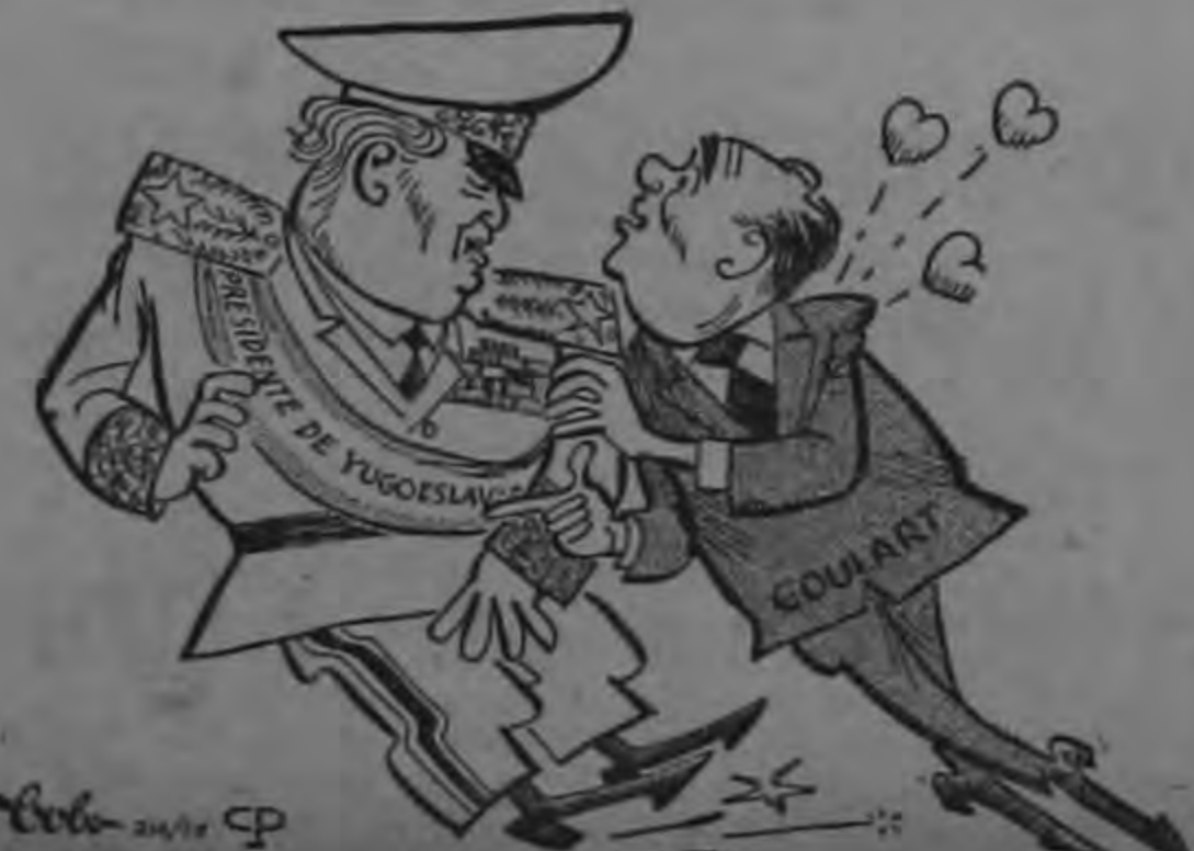
¿COMO CONSEGUISTE HACERTE PRESIDENTE VITALICIO?

Hubo informes periodísticos sin confirmación oficial de que tuvieron lugar unas 25 muertes en la zona del desastre.